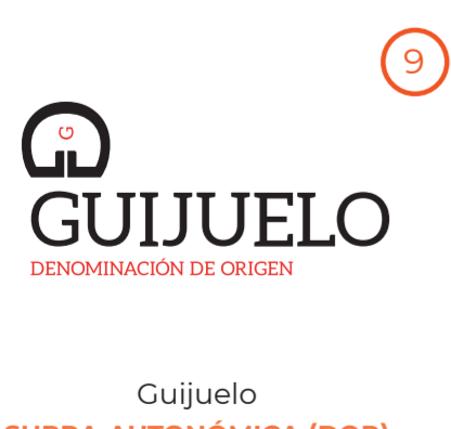
Guijuelo SUPRA-AUTONÓMICA (DOP)