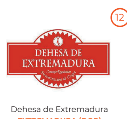
Dehesa de Extremadura EXTREMADURA (DOP)