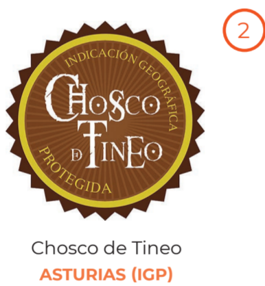
Chosco de Tineo ASTURIAS (IGP)