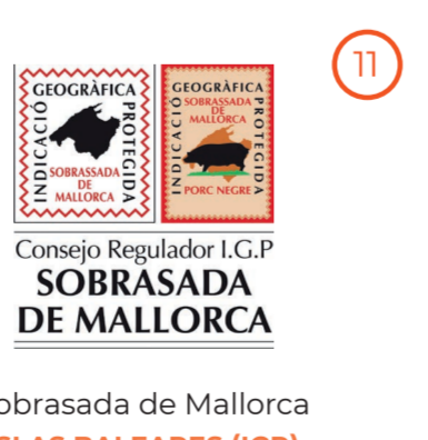
Sobrasada de Mallorca ISLAS BALEARES (IGP)