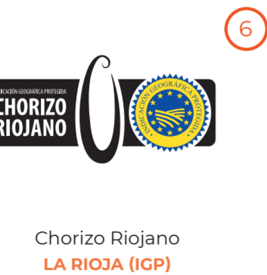
Chorizo Riojano LA RIOJA (IGP)