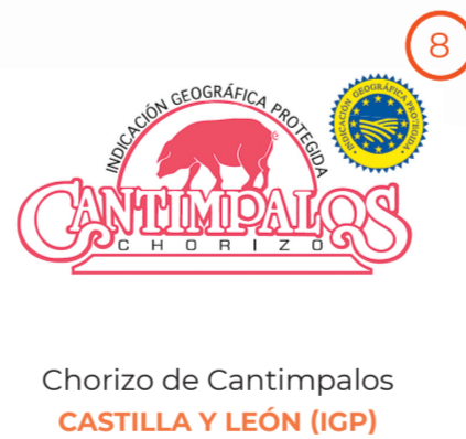
Chorizo de Cantimpalos CASTILLA Y LEÓN (IGP)