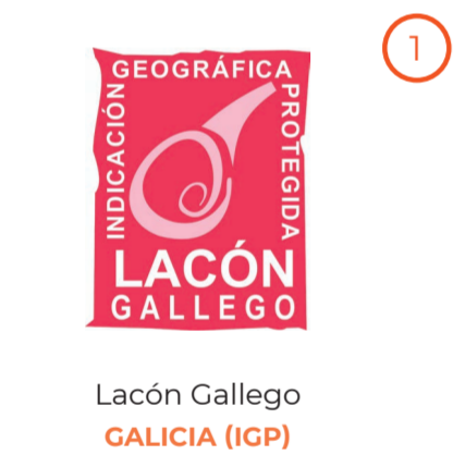
Lacón Gallego GALICIA (IGP)