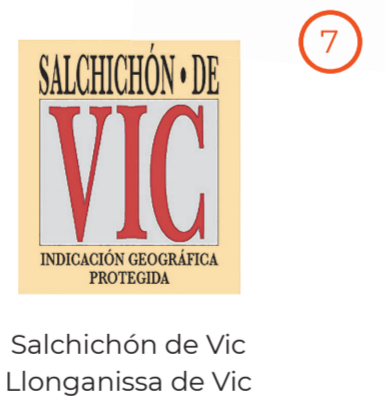
Salchichón de Vic Llonganissa de Vic CATALUÑA (IGP)