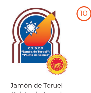
Jamón de Teruel Paleta de Teruel ARAGÓN (DOP)