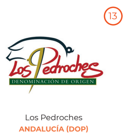
Los Pedroches ANDALUCÍA (DOP)