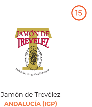
Jamón de Trevélez ANDALUCÍA (IGP)