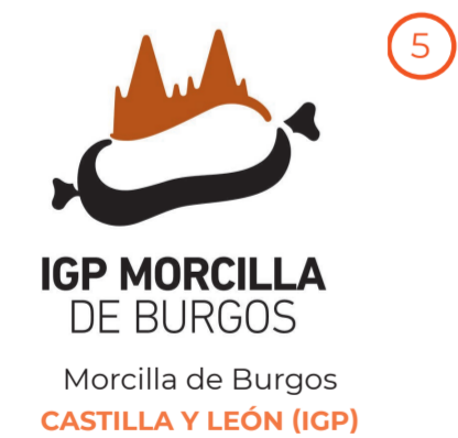
Morcilla de Burgos CASTILLA Y LEÓN (IGP)