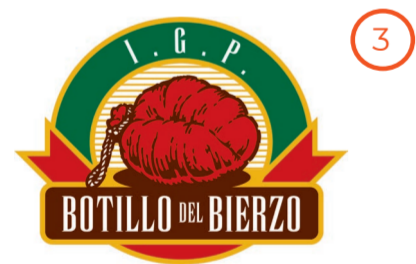
Botillo del Bierzo CASTILLA Y LEÓN (IGP)