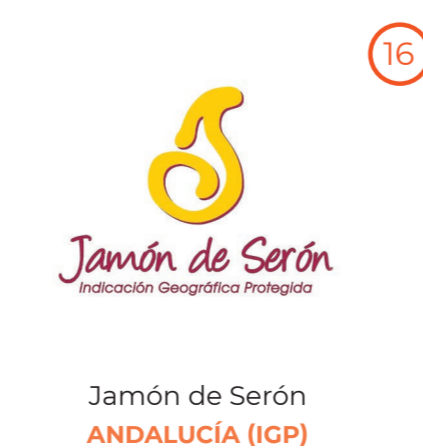
Jamón de Serón ANDALUCÍA (IGP)